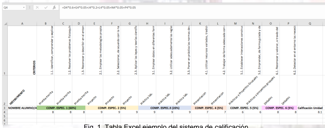
Fig. 1. Tabla Excel ejemplo del sistema de calificación.

Todas las competencias específicas y sus criterios de evaluación serán trabajadas en cada unidad didáctica, asociadas a los distintos saberes básicos. En las distintas actividades evaluables propuestas en la programación de aula para cada unidad didáctica se especificarán los criterios de evaluación asociados, así como sus competencias específicas ponderadas. De esta forma, el indicador de logro final para cada criterio será el promedio de todos los indicadores de logro obtenidos cada vez que haya sido calificado y el indicador de logro para la competencia específica será el promedio de sus criterios asociados. La calificación de la unidad vendrá dada por la media ponderada de los indicadores de logro obtenidos para cada una de las competencias específicas (ejemplo Fig. 1).