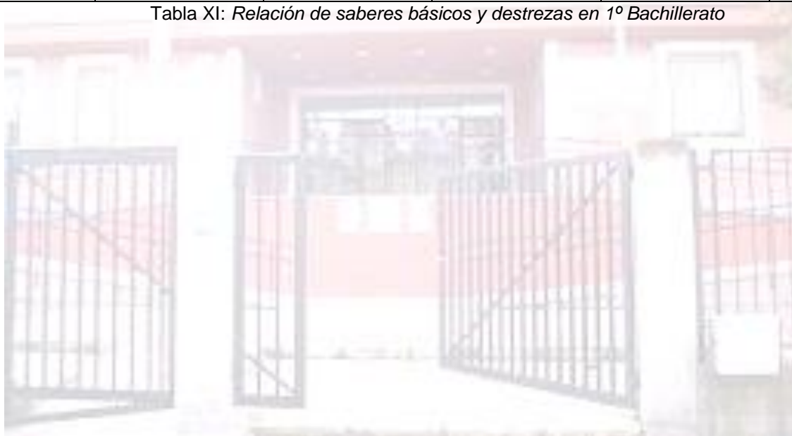
Tabla XI: Relación de saberes básicos y destrezas en 1º Bachillerato